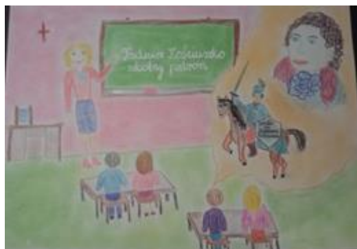
Iga Kućmierowska kł. III c