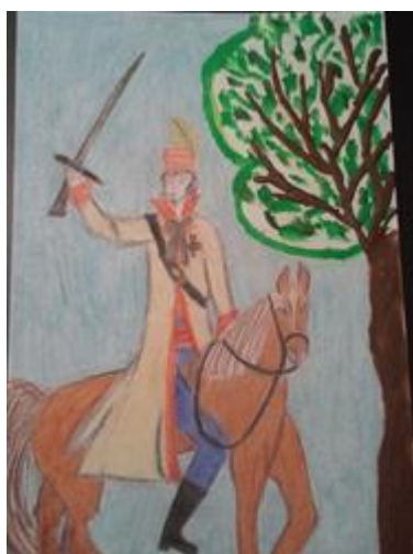
Wiktoria Mierzejewska kł. III b