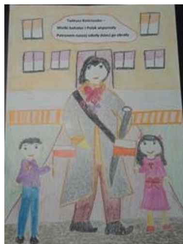
Łucja Lubowicka kł. III c